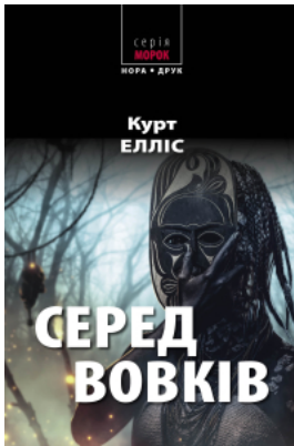
Серед вовків. Роман