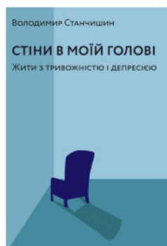
Стіни в моїй голові. Жити з тривожністю і депресією