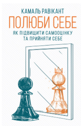
Полюби себе. Як підвищити самооцінку та прийняти себе