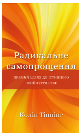
Радикальне самопрощення. Прямий шлях до істинного прийняття себе