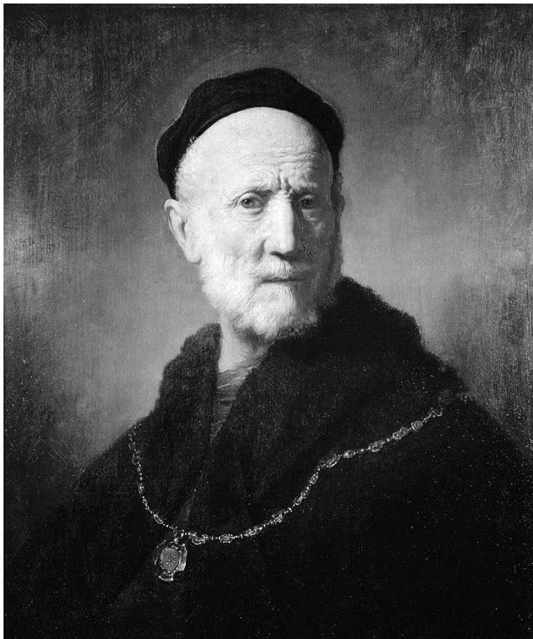
Рембрандт. Отец (1631).