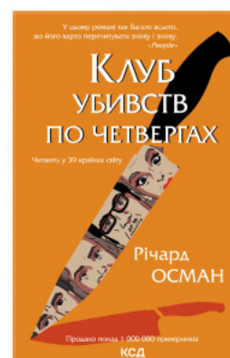
Клуб убивств по четвергах