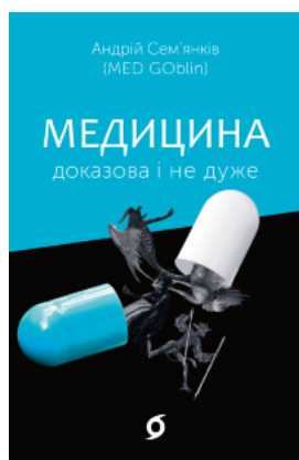
Медицина доказова і не дуже