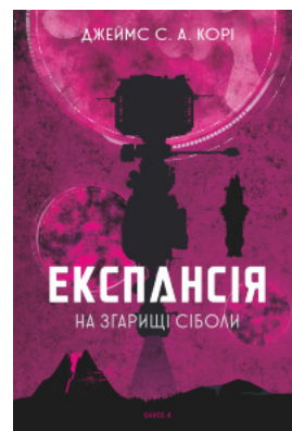
Експансія. Кн.4. На згарищі Сіболи