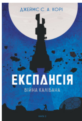
Експансія. Кн. 2