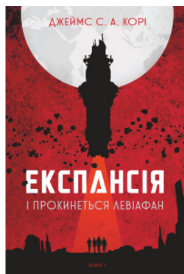
Експансія. Кн. 1