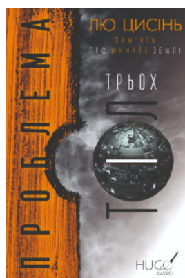
Проблема трьох тіл