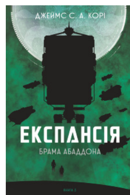
Експансія. Кн. 3